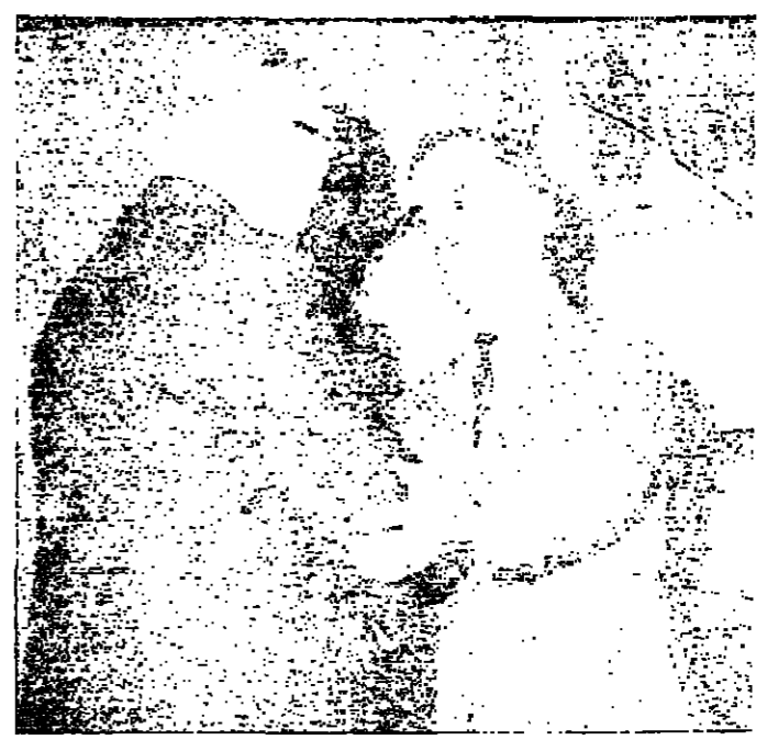
جلالة الملك الحظير يقبل تهنئة السيد سعيد الحقي رئيس مجلس الامانة بسلاطين الشوكة المسمى ارسلوا في تصوير سبراميس